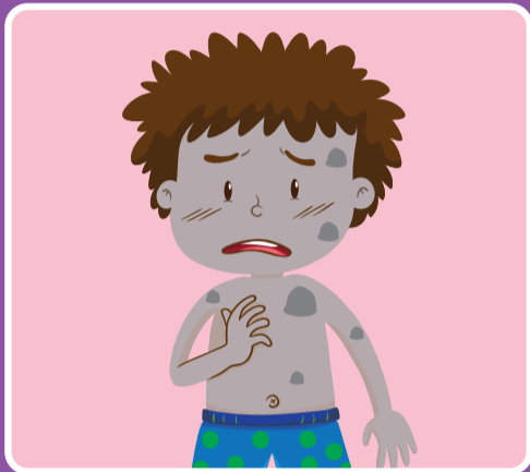
အရေပြားသည် အေးစက်နေခြင်း သို့မဟုတ် ကွက်ကြားကွက်ကြား ဖြစ်နေခြင်း၊ အရောင်ပျော့ နေခြင်း၊ နီရဲနေခြင်း သို့မဟုတ် အရောင်ပြောင်းနေခြင်း