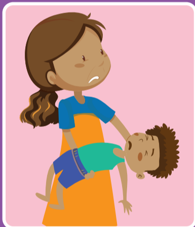
ဂဏာမငြိမ်ဖြစ်နေခြင်း၊ သို့မဟုတ် ခြေလက်အင်္ဂါများ အားပျော့နေခြင်း