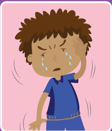
ပြင်းပြင်းထန်ထန် ခေါင်းကိုက်ခဲခြင်း - - ဇက်၊ ကြွက်သား၊ ရင်ဘတ်၊ ခြေဆံလက်ဆံ သို့မဟုတ် အဆစ်အမြစ်များ ကိုက်ခဲနေခြင်း