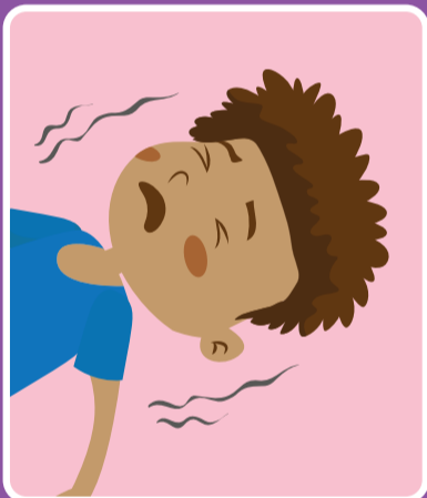
တက်ခြင်း သို့မဟုတ် အကြောဆွဲခြင်း