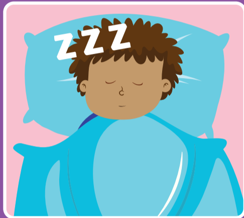
အိပ်ချင်မှုူးတူးဖြစ်နေခြင်း၊ ဇဝေဇဝါဖြစ်နေခြင်း၊ နှိုးရခက်နေခြင်း