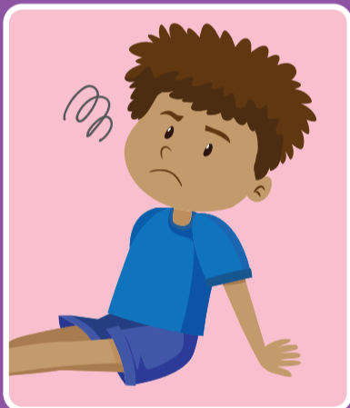
လမ်းမလျှောက်နိုင်ခြင်း၊ သို့မဟုတ် လမ်းလျှောက်လိုစိတ် မရှိခြင်း