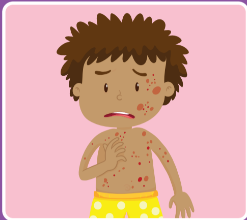
ဖိလိုက်သည့်အခါ လျော့မသွားသည့် အဖုအပိန့် သို့မဟုတ် ပွန်းပဲ့ဒဏ်ရာလေးများစွာ ရှိသလို ဖြစ်နေခြင်း